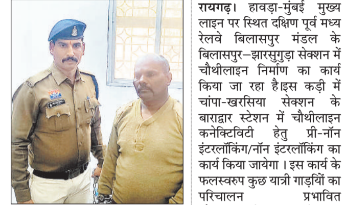
पीएम के लिए शव को अस्पताल ले जाते आरपीएफ के जवान इनसेट में मृतक और रेलवे पुलिस के बाहर लगी भीड़, गिरफ्त में आरोपी।